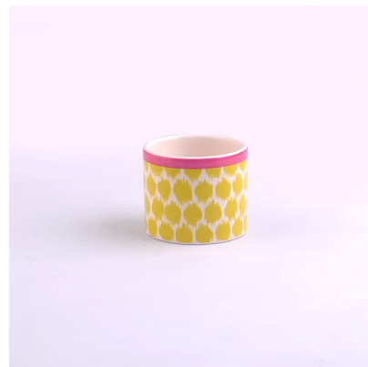
pittura colorata portacandele in ceramica