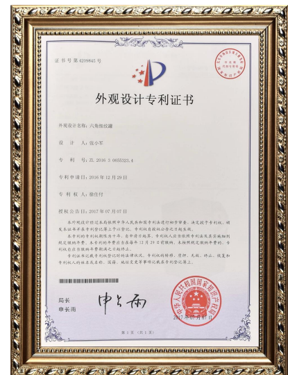
Brevetto n. 2.201630655323.4