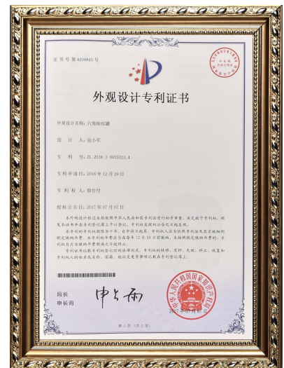
Numero di brevetto: 201630655323.4