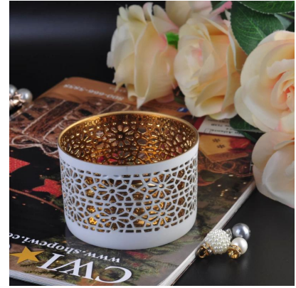
Interno Galvanotecnica Tealight portacandele in ceramica