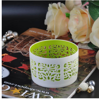
Commercio all'ingrosso portacandele in ceramica colorata scavatotitolare -out