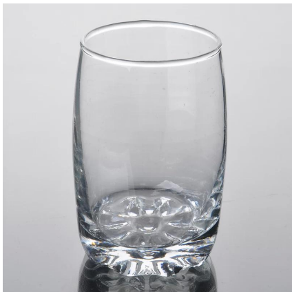
Coppa in vetro soffiato macchina