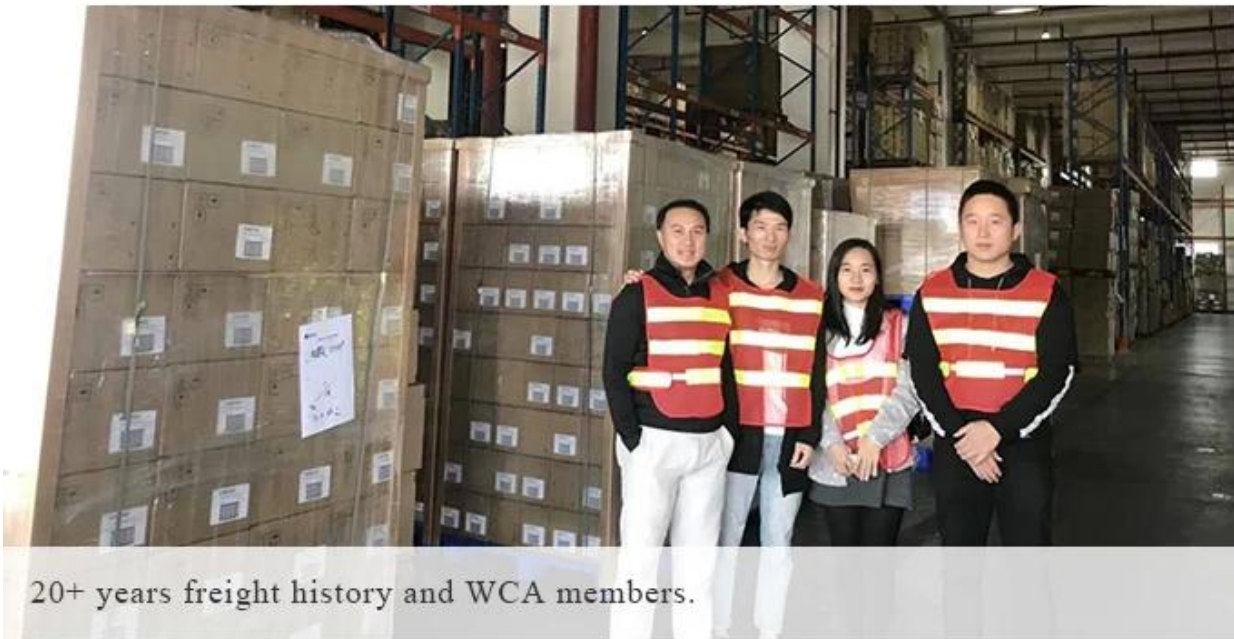
20+ years freight history and WCA members.