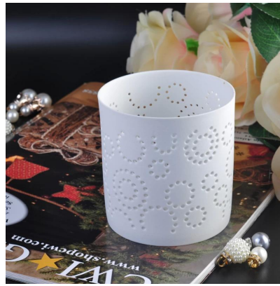
Recipienti di ceramica cilindro bianco