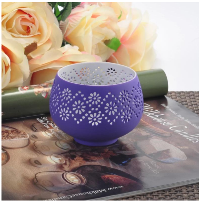
Vasi della candela in ceramica all'ingrosso