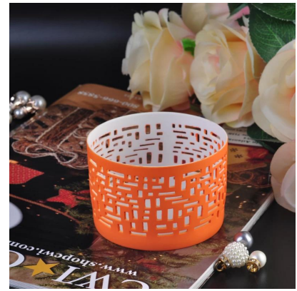
Colorata supporti votive all'ingrosso