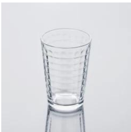
acclamazione recycled bicchiere di vetro