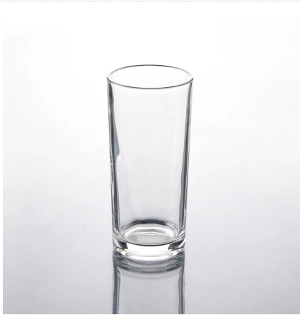
Vetro altamente trasparente