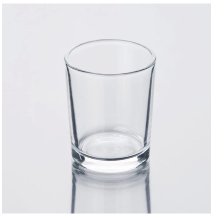
Transparent bambino vetro