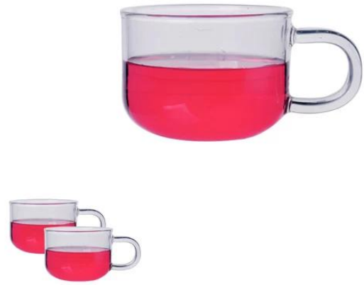
vetro borosilicato a parete singola