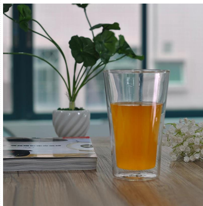
Doppia parete di vetro di bevande in vetro