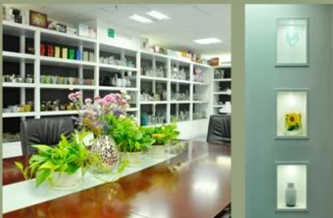
Esposizione della fabbrica: