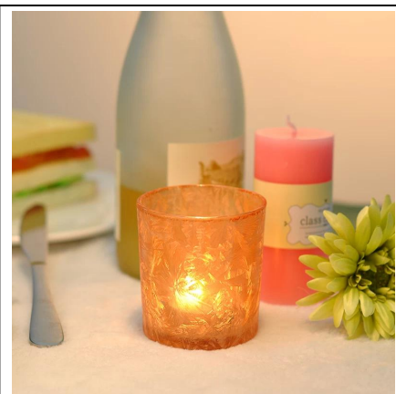
I titolari di vetro glassato Candela votiva