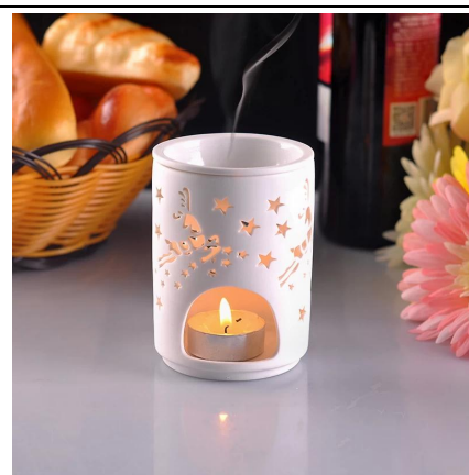
_disegno vuoto veglia ceramica portalampada di candela