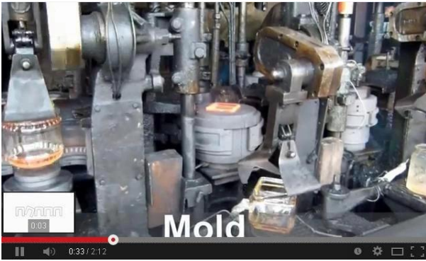
È il metodo della macchina