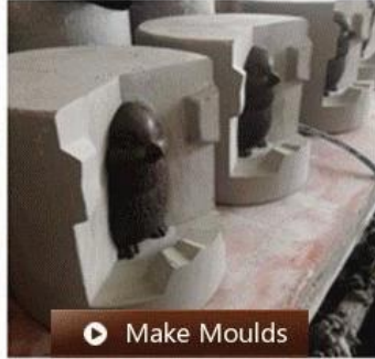
▶ Make Moulds