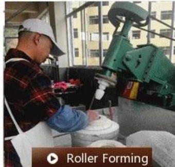
▶ Roller Forming