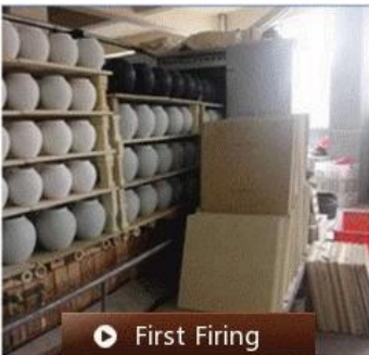
▶ First Firing