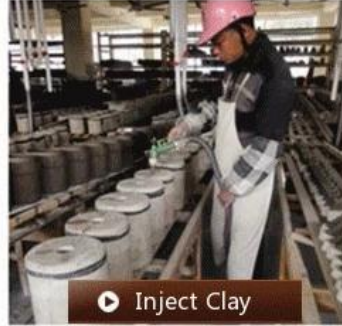
▶ Inject Clay