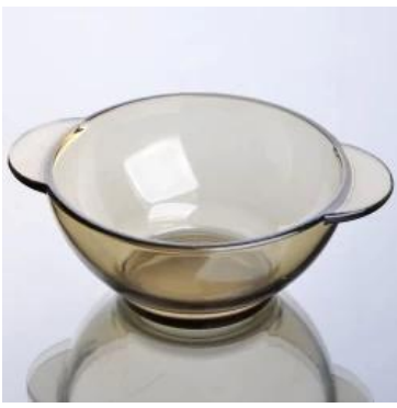
title = "contenitore in vetro 3050ml con coperchio rosso"