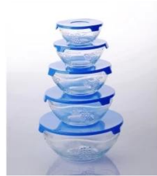
tondo stoviglie sigillato ciotola di vetro