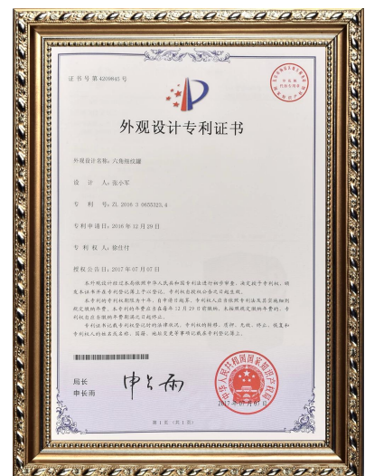
Brevetto n.: 201630655323.4