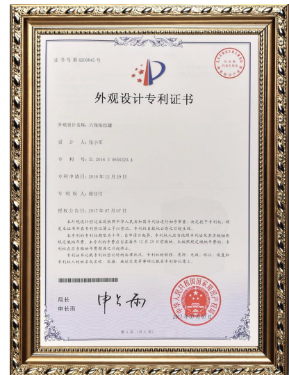
Brevetto n. 2.201630655323.4