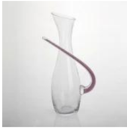
handblown carafe à vin