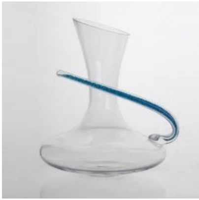
La main de conception unique décanter à vin soufflé