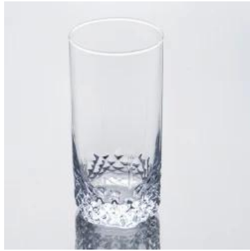
L'eau de verre tumbler résistant à la chaleur