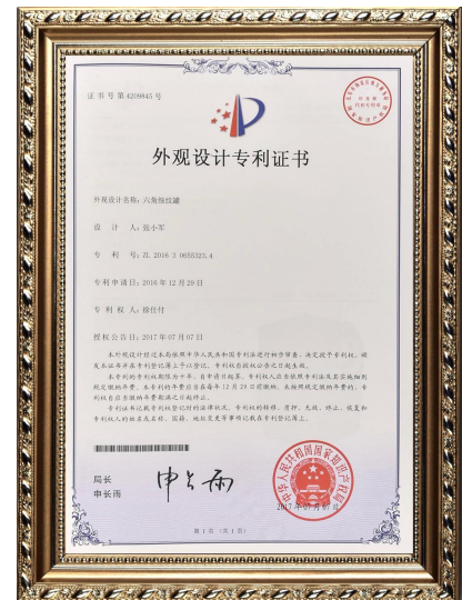
Brevet n. 2.01630655323.4