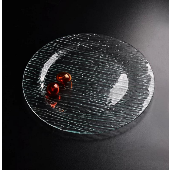
plaque ronde en verre transparent