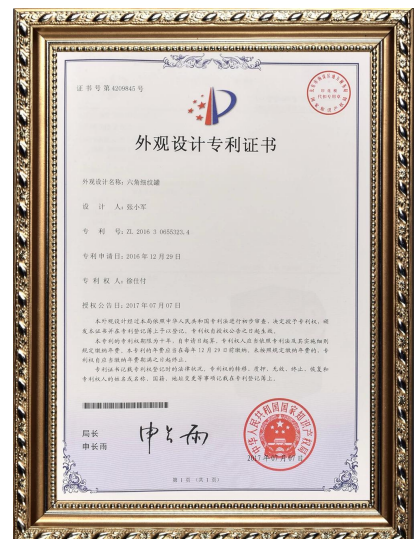
Brevet n °: 201630655323.4