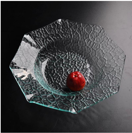
.polygone plaque de verre clair