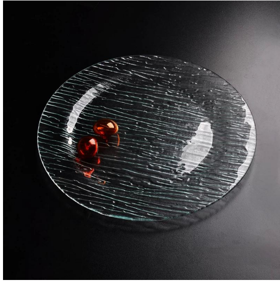
plaque ronde en verre transparent