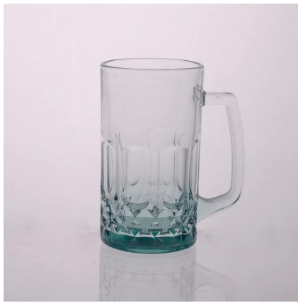
18 onces chope de bière en verre