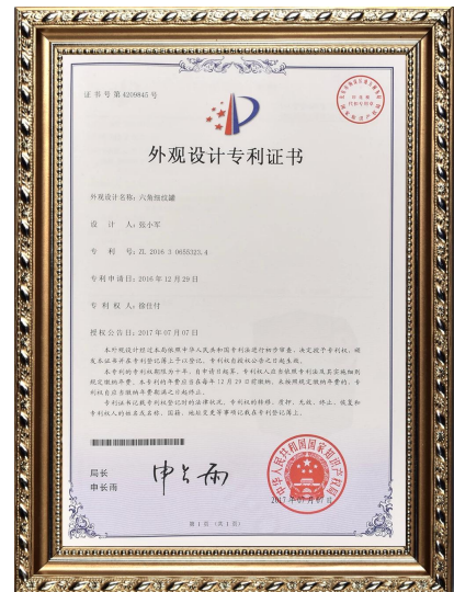
Brevet n °: 20163065523.4