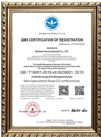
ISO 9001: 2015