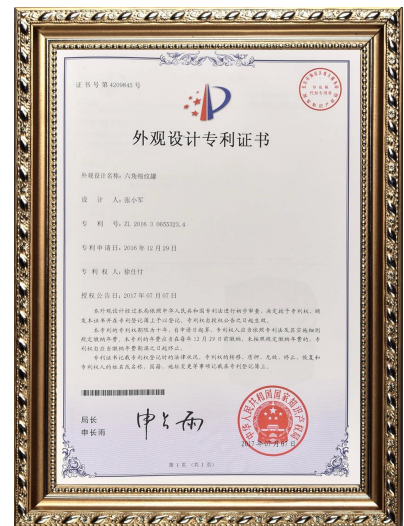
N° de brevet: 201630655323.4