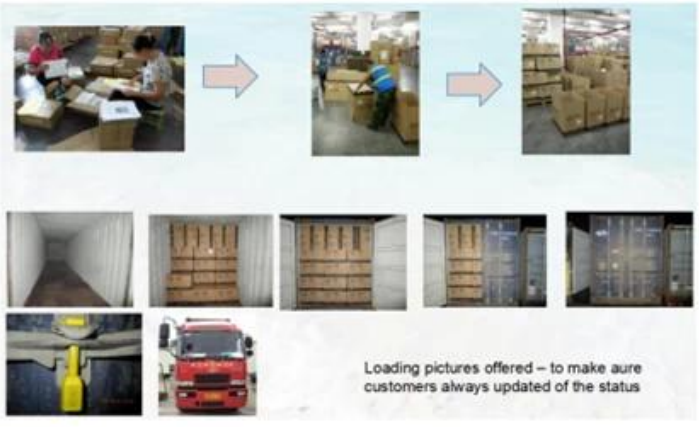
Loading pictures offered – to make sure customers always updated of the status