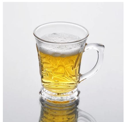
tasse en verre de gros