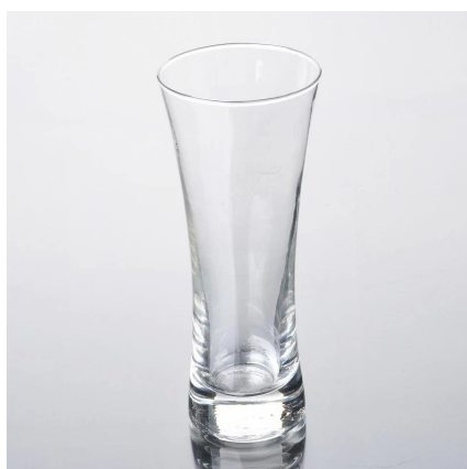
à long verre de bière