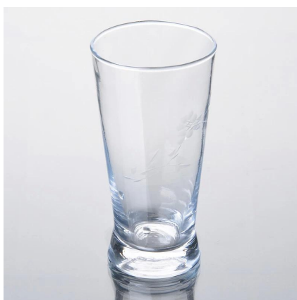
tasse en verre de bière