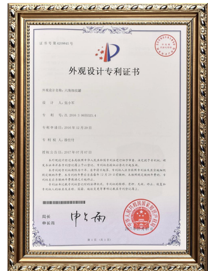
Numéro de brevet: 201630655323.4