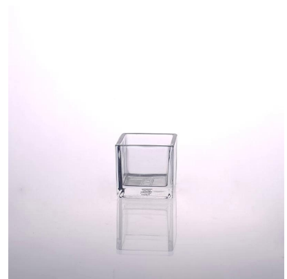
bougeoir carré en verre de décor à la maison