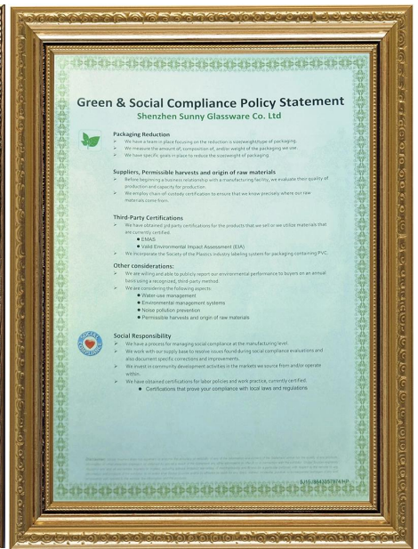
Responsabilité écologique et sociale Déclaration de Policy