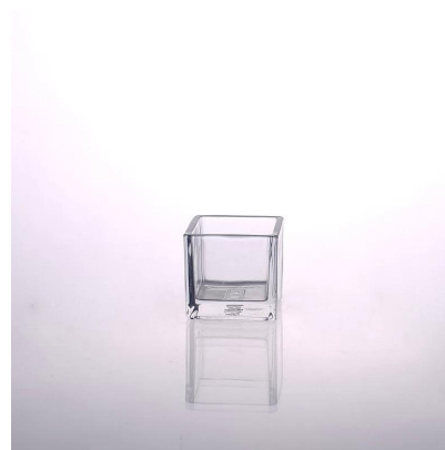
bougeoir carré en verre de décor à la maison