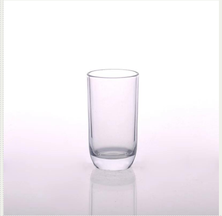
jus de l'eau du thé au lait gobelet en verre potable