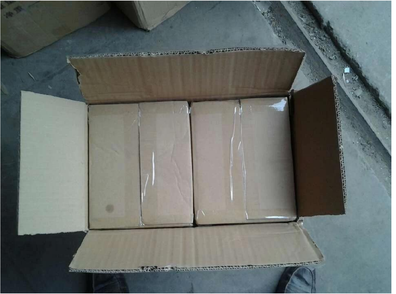
processus de Produce: