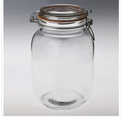
grand bocal en verre