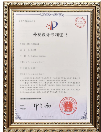
Brevet n. 2.20163065523.4