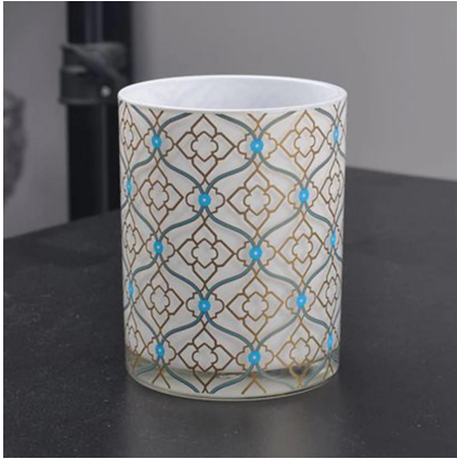
impression autocollant bougeoir en verre