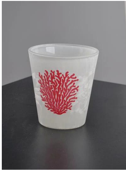
bougeoir de verre pulvérisé