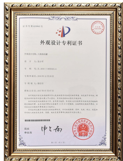
Brevet n °: 20163065523.4