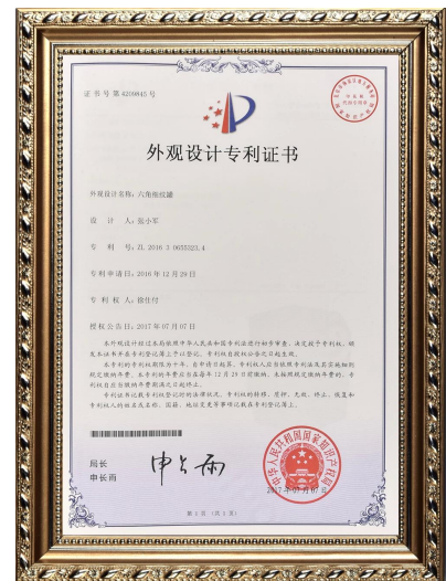
Brevet n °: 201630655323.4