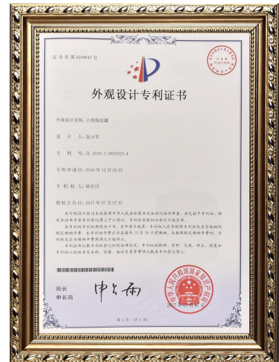
Brevet n °: 201630655323.4