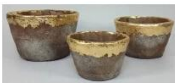
CS10026A-2 20x20x12.5cm CS10026B-2 17x17x10cm CS10026C-2 14x14x9cm