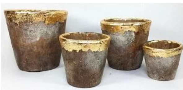
CS10025A-4 20.5x20.5x19.5cm CS10025B-4 17.5x17.5x16.5cm CS10025C-4 14.5x14.5x14cm CS10025D-4 11.5x11.5x10.5cm CS10025E-4 8x8x7cm