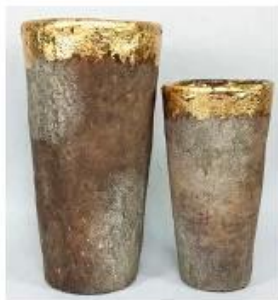
CS10024A-1 14x14x26cm CS10024B-1 11x11x20cm