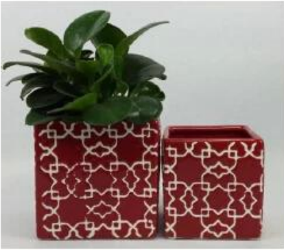
Red S16030-127 12.5×12.5×12.0cm S16030-102 10.0×10.0×10.0cm