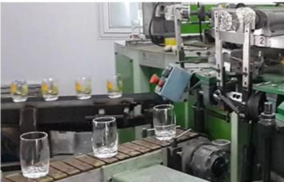
05 SCREEN PRINTING