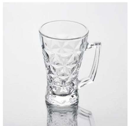
tasse en verre de gros