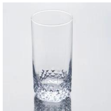
L'eau de verre tumbler résistant à la chaleur