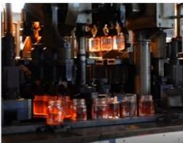
The ranks of machine