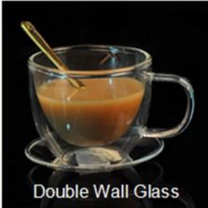
Double Wall Glass