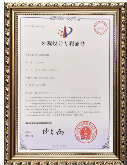
Numéro de brevet: 201630655323.4