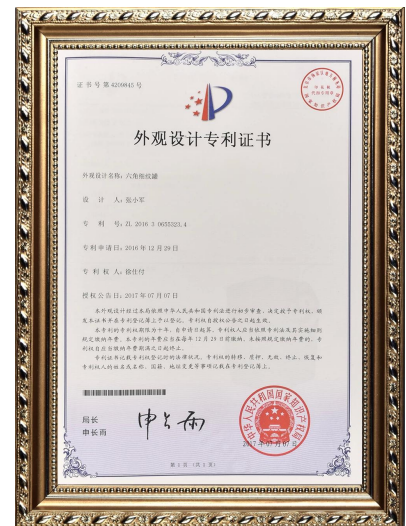
Numéro de brevet: 201630655323.4