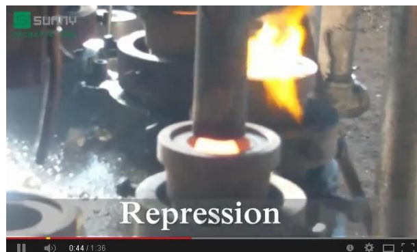
Technologie de la presse mécanique