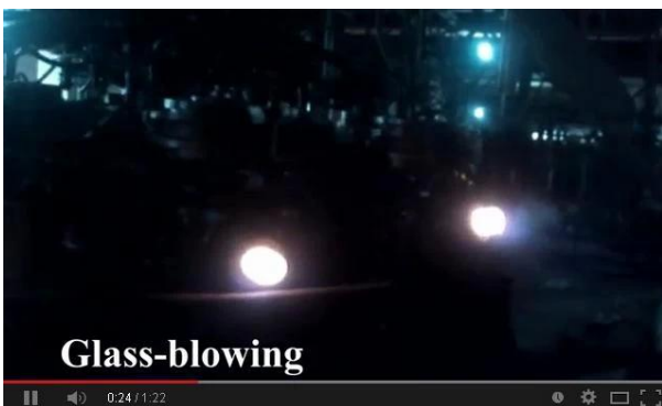
Technologie de soufflage à la machine

Regardez la vidéo de notre ligne de production en ligne, bienvenue sur notre site.